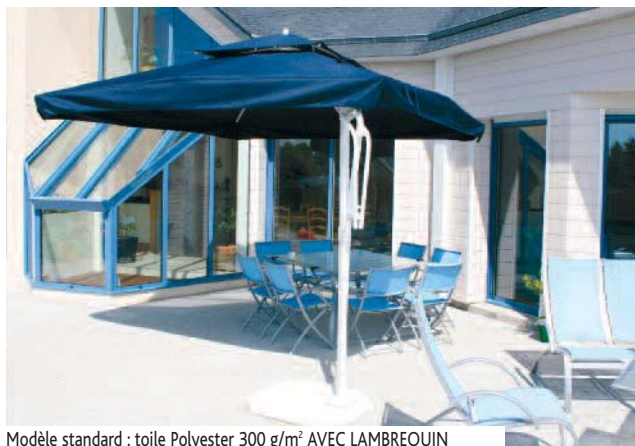
Modèle standard : toile Polyester 300 g/m 2 AVEC LAMBREQUIN