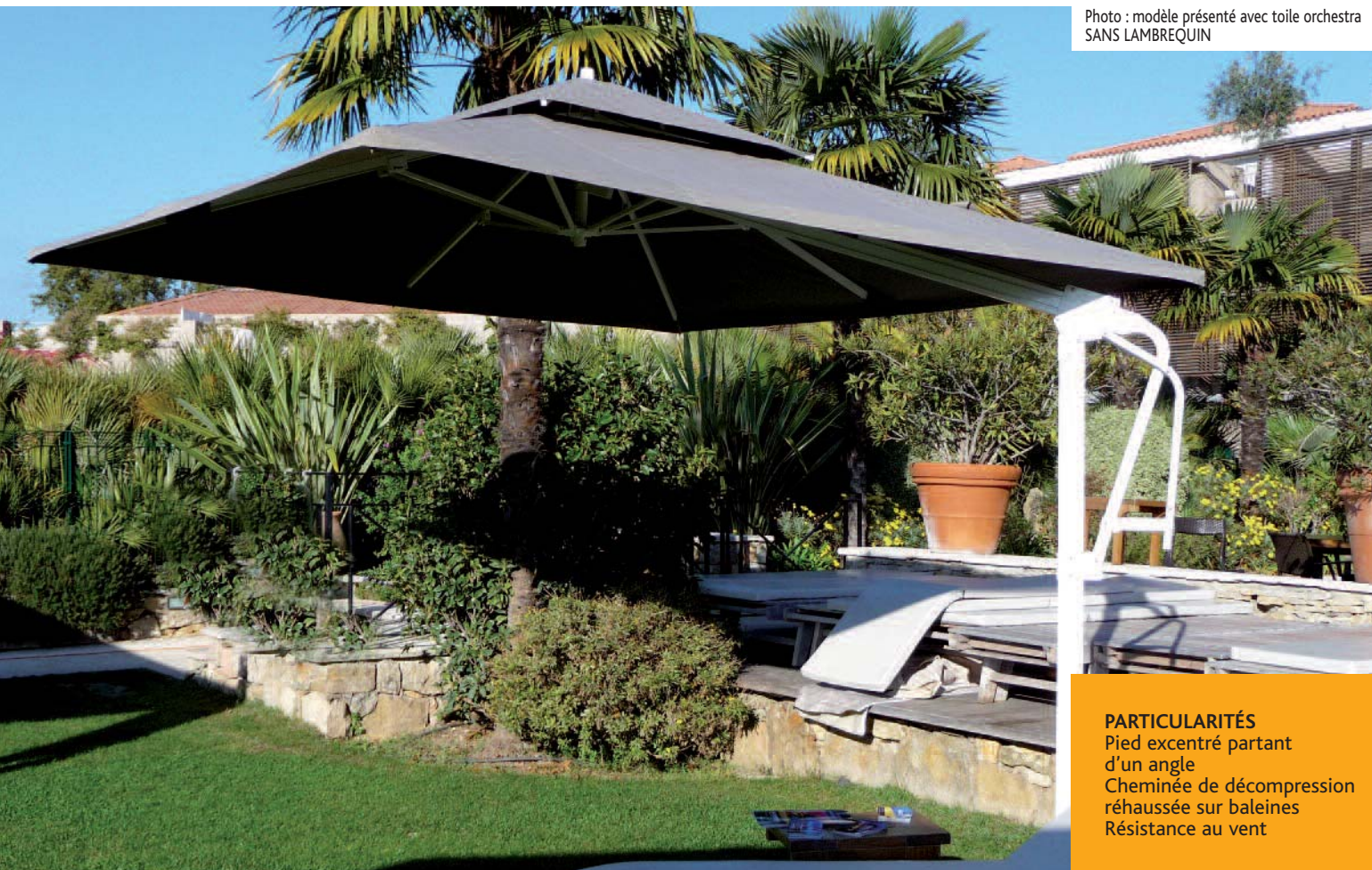
Photo : modèle présenté avec toile orchestra SANS LAMBREQUIN

Armature en aluminium thermo-laqué blanc / White powder coated aluminium frame / Armadura de aluminio termolacado blanco