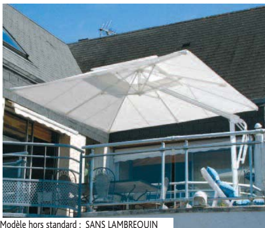
Modèle hors standard : SANS LAMBREQUIN